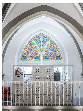
/ St. Johann Konstanz